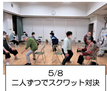
5/8 二人ずつでスクワット対決