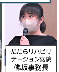
たたらリハビリテーション病院 佛坂事務長