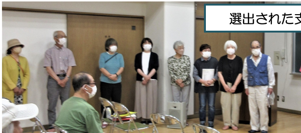
選出された支部役員